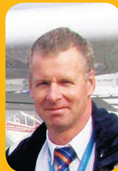
...vrij als een vogeltje...

bekijken van het weer voor die dag. Als het gaat stormen, moet ik de vluchten voor die dag afbellen. Om een uur of tien ga ik meestal de eerste keer de lucht in. En nu het zo lang licht is, gaat dat door tot laat in de avond.”